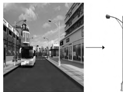
图2 地理单实体示例